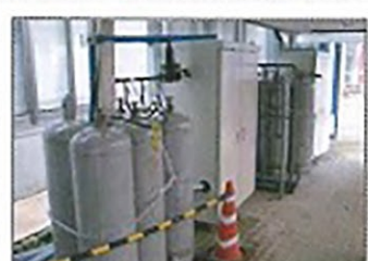
新潟中越沖地震 救急指定病院(厨房)