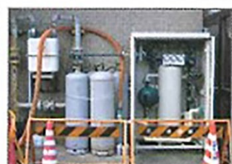
新潟中越沖地震 老人福祉施設