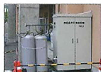
新潟中越沖地震 老人福祉施設