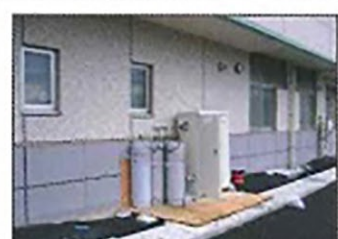
新潟中越沖地震 老人福祉施設