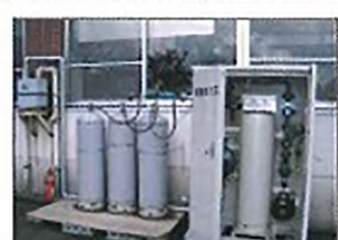
新潟中越沖地震 救急指定病院(GHP)