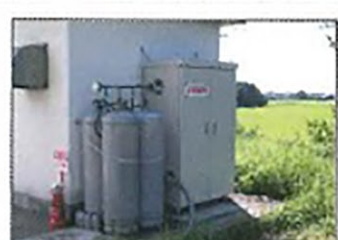
新潟中越沖地震 避難場所(中学校)